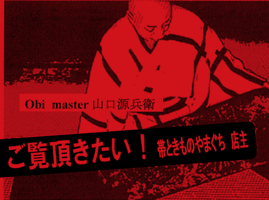
Obi master 山口源兵衛

世界的ミュージシャンはクラシックを学ぶらしい ロックであれ ジャズであれ 基礎のないアーティストは 結局ものにならないと云う 原点から出り 原点へ帰る この住環境の中で 普遍性のあるモノづくりが出来ればと念じ 源に立ち還り 40年の帯づくりを捨て切り 新たに挑戦したい。 誉田屋10代目山口源兵衛